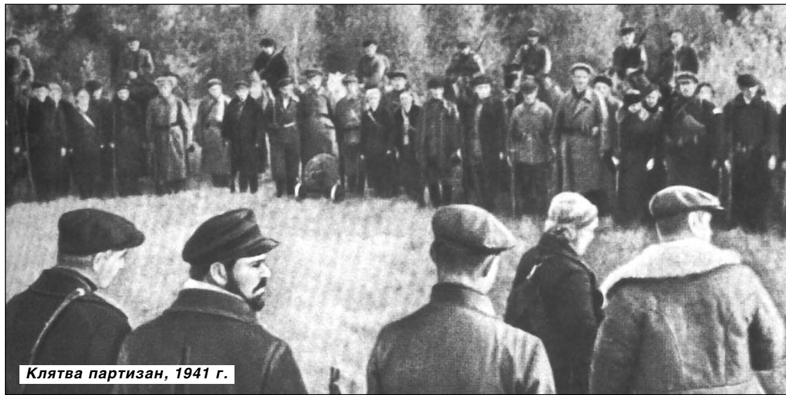
Клятва партизан, 1941 г.