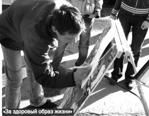
«За здоровый образ жизни» «Плоды» акции

– Мы вам – конфеты, вы нам – сигареты, – заманчиво предлагали девчонки проходя на рыночной площади Щербинки 16 октября. Это первая акция осеннего марафона «За здоровый образ жизни», который проводит молодежный комитет города и «Молодежное Единство».