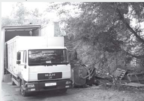
«Пятёрочка» на ул. Высотной. Вид со двора

Мы уже дважды штрафовали администрацию обоих магазинов, обращались с соответствующим письмом к вышестоящему руководству, но в ответ получали одни обещания. Требования по благоустройству прилегающей территории по сей день не выполнены, да и фасады зданий тоже оставляют желать лучшего.