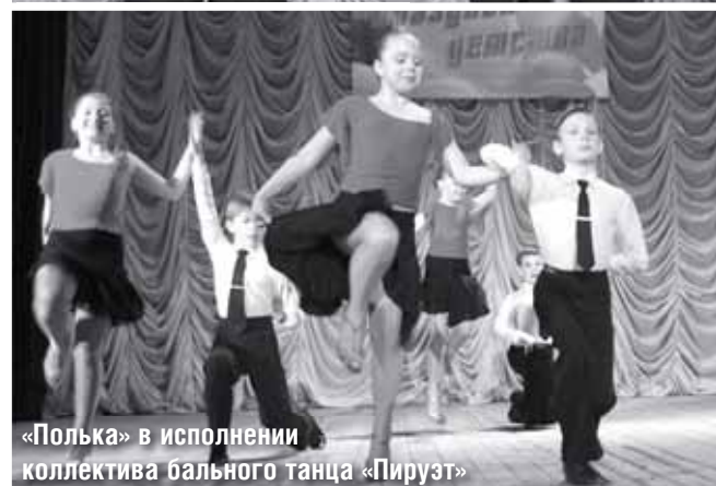
«Полька» в исполнении коллектива бального танца «Пируэт»