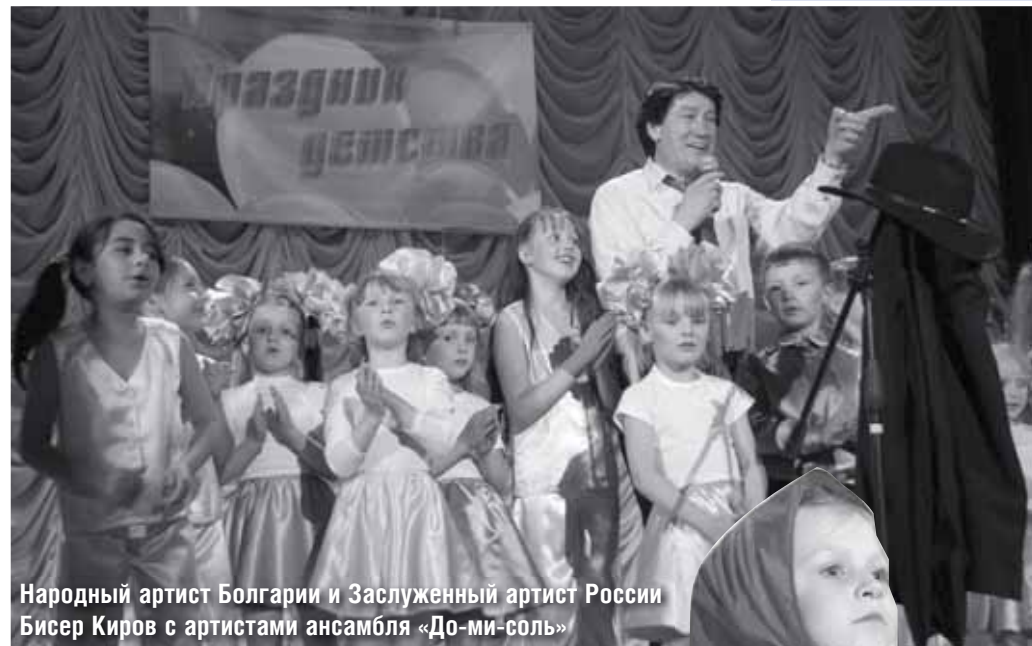
Народный артист Болгарии и Заслуженный артист России Бисер Киров с артистами ансамбля «До-ми-соль»

И пока в доме детский смех, От игрушек некуда деться, Вы на свете счастливей всех. Берегите, пожалуйста, детство!