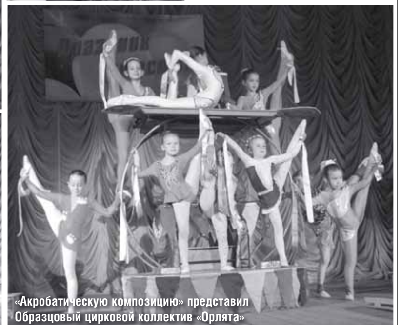
«Акробатическую композицию» представил Образцовый цирковой коллектив «Орлята»