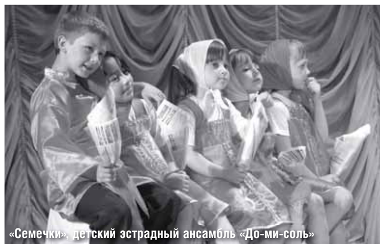
«Семечки», детский эстрадный ансамбль «До-ми-соль»