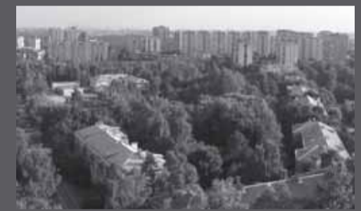
города микрорайоном вошел поселок гарнизона Остафьево, а в 2005 г. Щербинке присвоен статус городского округа.

Интервью взяла Светлана ПРОХОРОВА