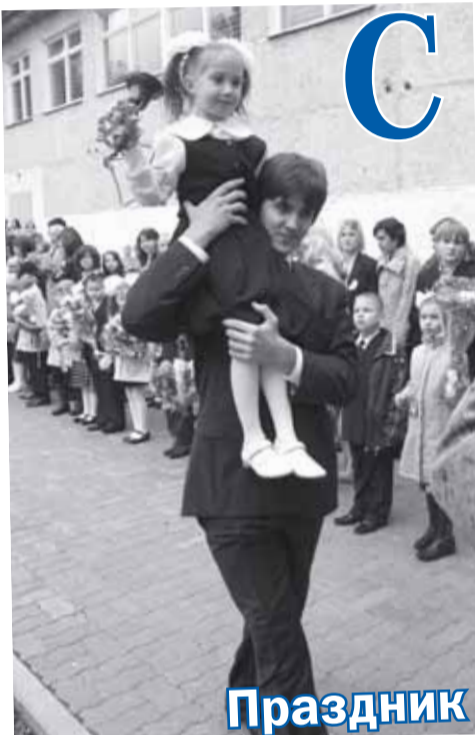
Праздник из года