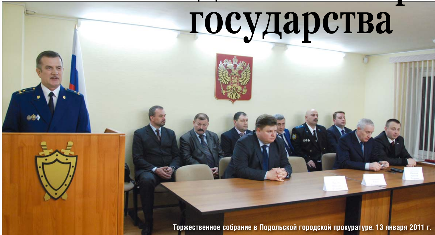
Торжественное собрание в Подольской городской прокуратуре. 13 января 2011 г.

12 января работники прокуратуры нашей страны отмечают свой профессиональный праздник. Указом Президента Российской Федерации Б.Н. Ельцина от 12 декабря 1995 года был установлен «День работника прокуратуры Российской Федерации», впервые появившийся в нашем календаре в 1996 году.