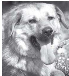
ЭММИ – большая и мохнатая, очень добрая, хорошо гуляет на поводке