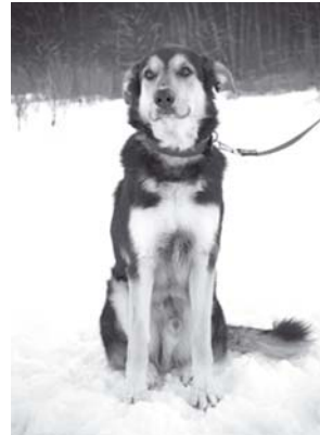
УШАН – долго скитался и голодал, попал под машину, но остался добрым, ласковым, веселым и послушным