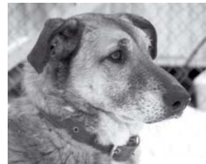
КЛУНИ – необыкновенно ласковый и добрый пес, любит детей